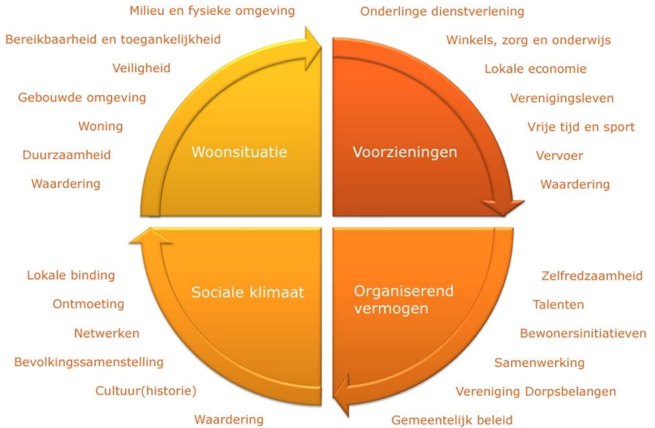
Figuur 1. Vier domeinen en domeinaspecten voor de leefomgeving.